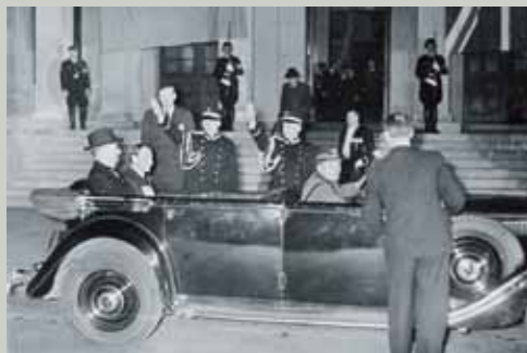
Premierminister Chamberlain bei den Verhandlungen zum Münchner Abkommen im „Führerbau“. Prime Minister Chamberlain during the negotiations for the Munich Agreement in the "Fuehrerbau".