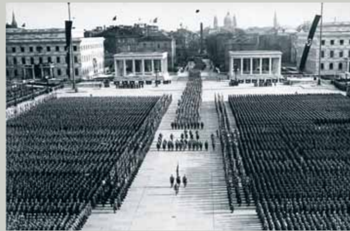
München – „Hauptstadt der Bewegung“

Als Gründungsort der NSDAP ist München eng mit dem Nationalsozialismus verstrickt. Die Stadt bot den Nährboden für die NS-Bewegung und ihre menschenverachtende Ideologie. In den rechtsextremen und antisemitischen Kreisen der Münchner Gesellschaft fand Adolf Hitler Ideengeber, Förderer und Anhänger.