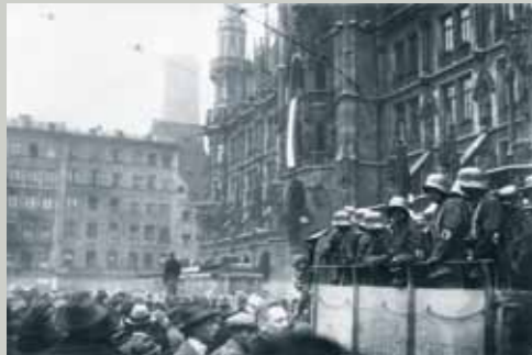
Hitler-Putsch 1923: Der Versuch, von München aus gewaltsam an die Macht zu gelangen. Beer Hall Putsch 1923: Hitler tried to violently usurp power from his base in Munich.

Wer nach Antworten sucht, kann sie in München finden, wo der Nationalsozialismus entstanden und groß geworden ist. Das NS-Dokumentationszentrum München setzt sich mit dieser schwierigen Vergangenheit auseinander und erklärt den Nationalsozialismus am historischen Ort.