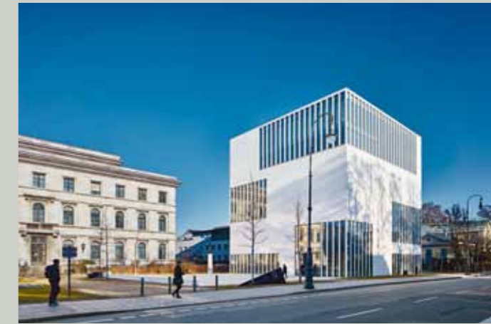
Munich – “Capital of the Movement”

As the place where the Nazi Party was founded, Munich is closely entwined with National Socialism. The city provided the fertile ground needed for the rise of the Nazi movement and its inhuman ideology. It was in Munich's far right-wing and antisemitic circles that Adolf Hitler absorbed extremist ideas and found willing patrons and followers.